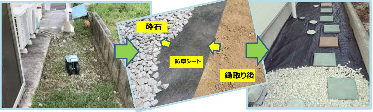
③防草シート+碎石 敷きこみ