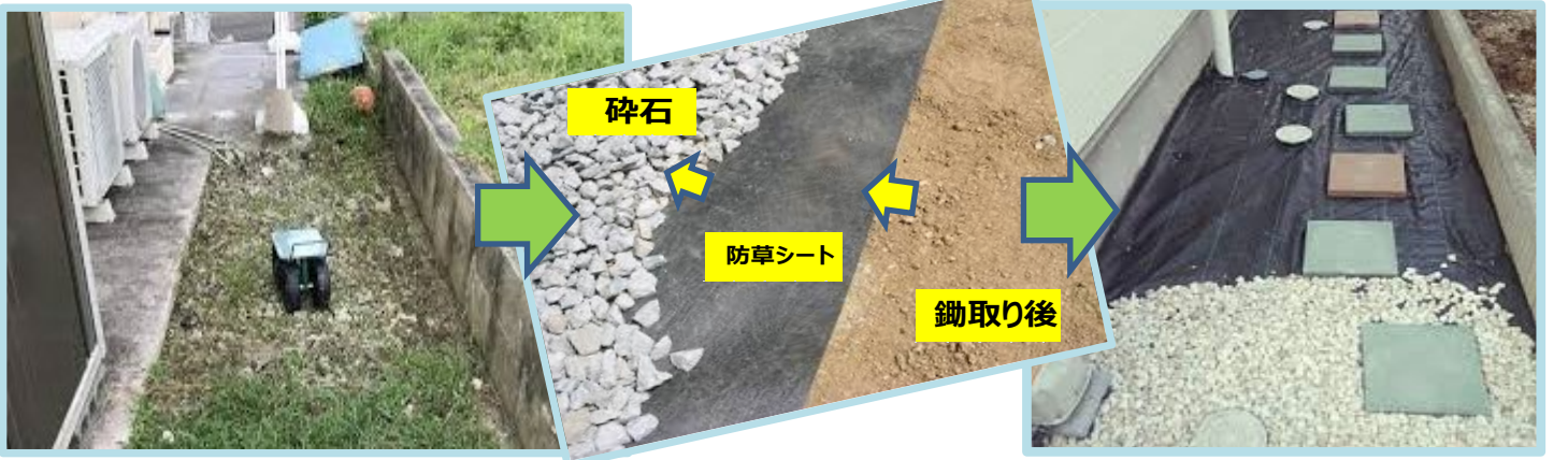
③防草シート+碎石 敷きこみ